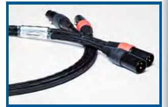
Photo: DUALITY XLR