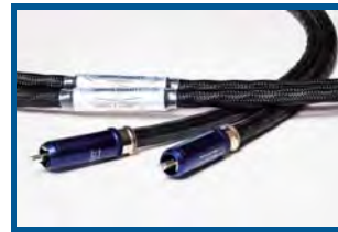
Photo: DUALITY RCA

ヨルマ・デザインのケーブルには何と言ってもナチュラルという言葉がよく似あう。このヨルマ・デュアリティーも例外ではない。素材そのものは従来モデルとほぼ同じだが、一聴して明らかな進化を感じた。やはりヨルマである。月並みなアップグレードでは済まなかった。その設計思想と製造技術の確固たる向上を認めざるを得ない。上位機種にあるヨルマ・デザイン独特の品格すら感じられる。音に滲みのない滑らかさがあり、声や楽器の質感が一層現実味を帯びる。ステージのバランスも余計な誇張感は一切なく、極自然である。また音楽に没頭できそうだ。