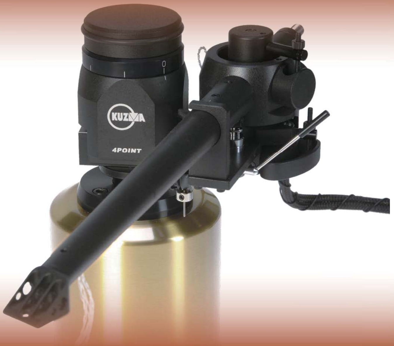
Kuzma 4Point Tonearm