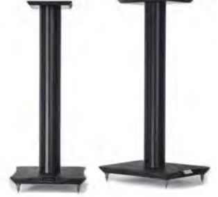
Black/Black Ash ブラック ブラックアッシュ