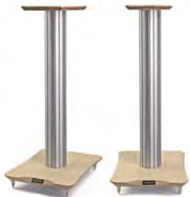
Silver/Birch シルバー バーチ