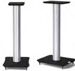
Silver/Black Ash シルバー ブラックアッシュ