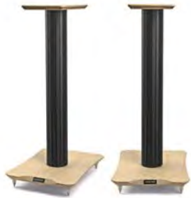
Black/Birch ブラック バーチ